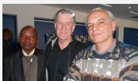
Trois de Barcelone 1996

Livres : du côté de chez Golden House Publications, Londres.