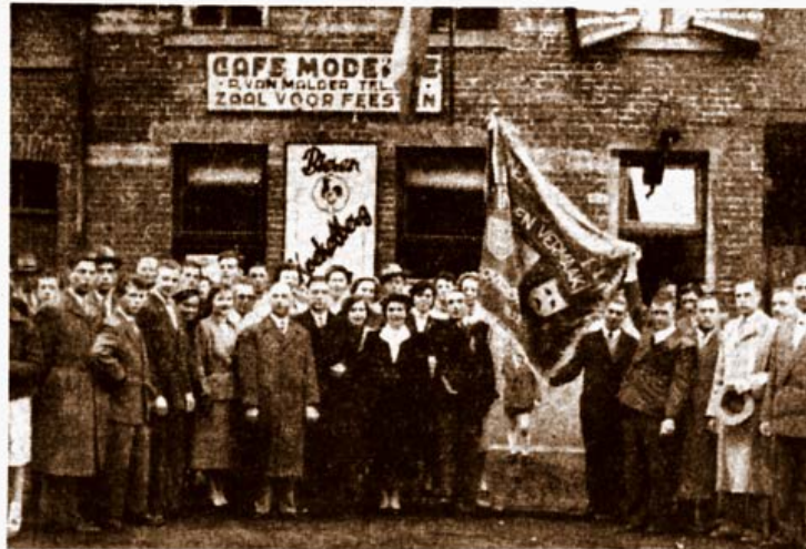
De vrienden van de plaatselijke toneelvereniging « Voor Nut en Vermaak », in feest, ter gelegenheid van hun vlaggewijding.